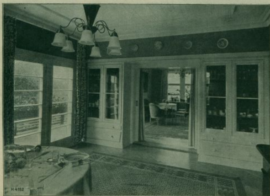
H 4152 Blockhaus Potsdam. Speisezimmer