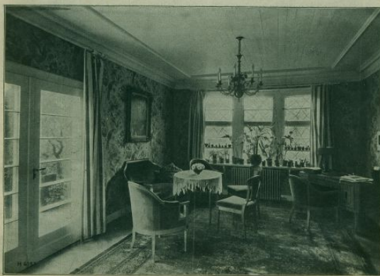
H 4151 Blockhaus Potsdam. Wohnzimmer

Ausführung: Christoph & Unmack A.-G., Abteilung Holzbau, Niesky O.-L.